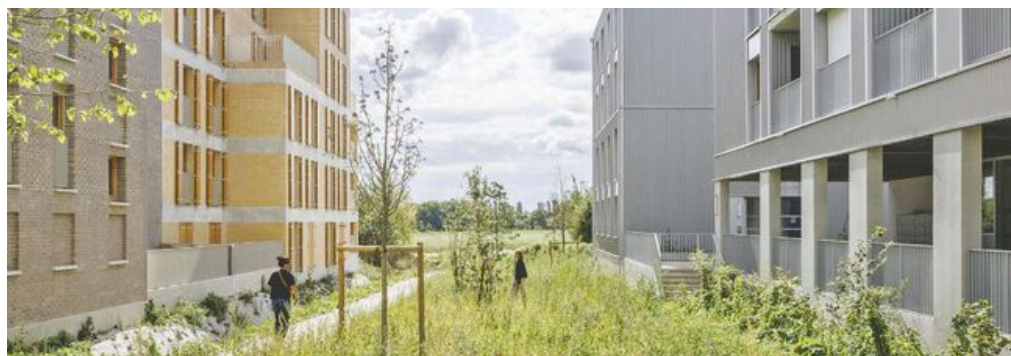
Projet «La frontière» : à Rungis, en grande négociation avec la plaine agricole

Dans la composition de ses travaux, la pleine terre a toujours un poids, que ce soit sous la forme de petite parcelle jardinée, de nature restaurée, de lisière forestière ou d'activité agricole préservée.