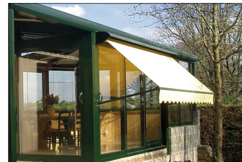
store en extérieur