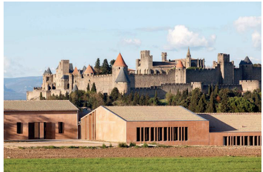
Extension/restructuration/cave viticole du lycée Charlemagne, Carcassonne, Passelac et Roques Architectes.

Celle-ci présente les 11 projets primés dont plusieurs dotés de mentions spéciales couronnant l'audace et l'engagement reconnus par le jury aux architectes et aux maîtres d'ouvrages. Pour l'architecte-urbaniste Djamel Klouche, Président du Jury, ils illustrent « dans une région où l'on construit beaucoup (...) une architecture pour habiter le monde, (...) transgresser le récit qui nous est vendu tous les jours ». Par leur diversité, ces projets offrent la possibilité d'envisager « plus finement la dimension narrative des activités humaines ».