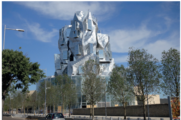
Fondation Luma, Arles, Frank Gehry Architecte

Inscriptions auprès de la Chartreuse de Villeneuve-lès-Avignon, 58 rue de la République, 04 90 15 24 24