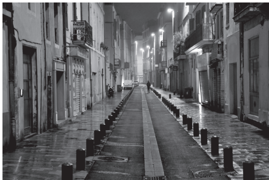
Après la pluie, Nîmes

Formation réservée aux enseignants du cycle 3 du 1er degré et tous niveaux de 2nd degré (offre académique parue sur GAIA)