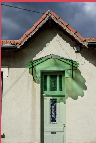
Marquise verte

A celles-ci s'ajoutera une sélection d'oeuvres complémentaires pour proposer une vision du Département à travers certains aspects du cadre de vie.