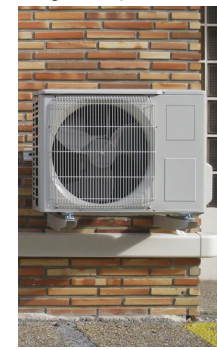
pompe à chaleur

Depuis Janvier 2021, les Conseillers énergie des Guichets Rénov'Occitanie apportent aux particuliers des conseils gratuits, personnalisés et indépendants sur les solutions techniques à mettre en œuvre pour réduire leur facture d'énergie, ainsi que sur les professionnels qualifiés et les aides financières disponibles.