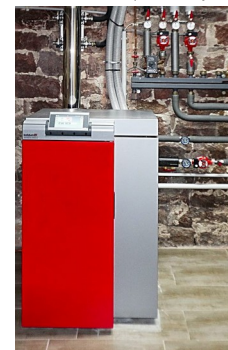
chaudière granulé bois