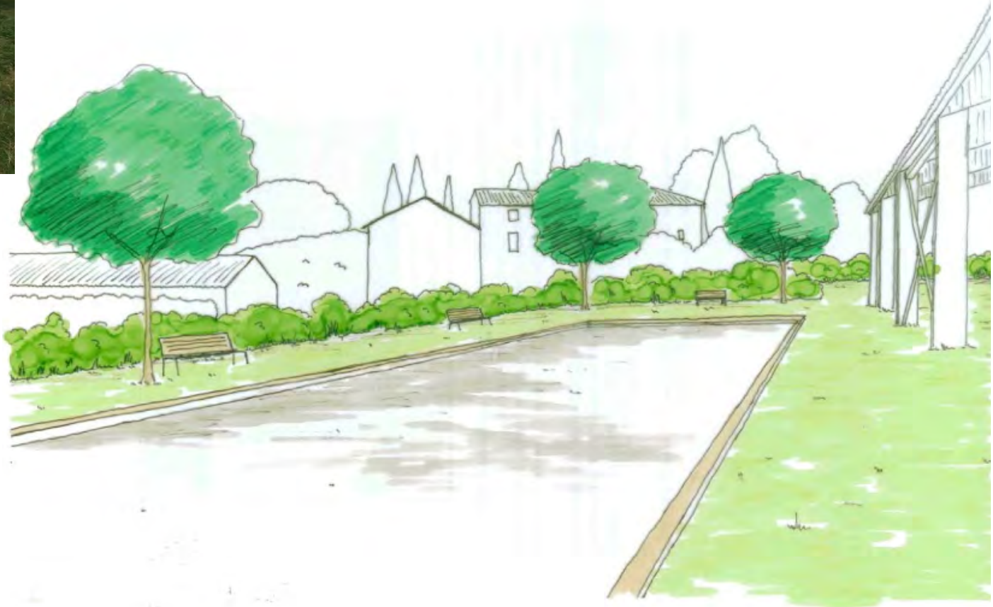
Le futur terrain de boules