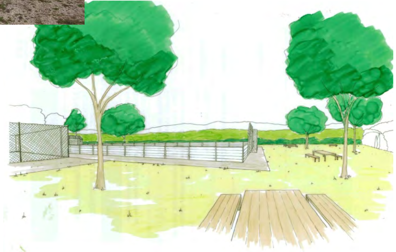
La plateforme inférieure