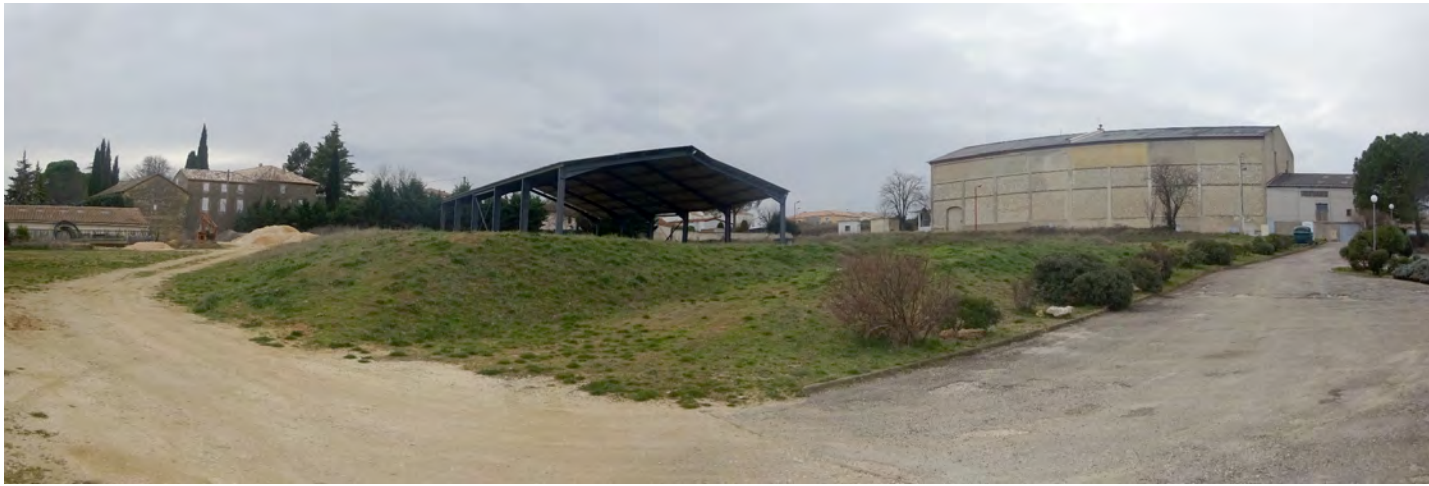
Le talus et les accès à la plateforme supérieure