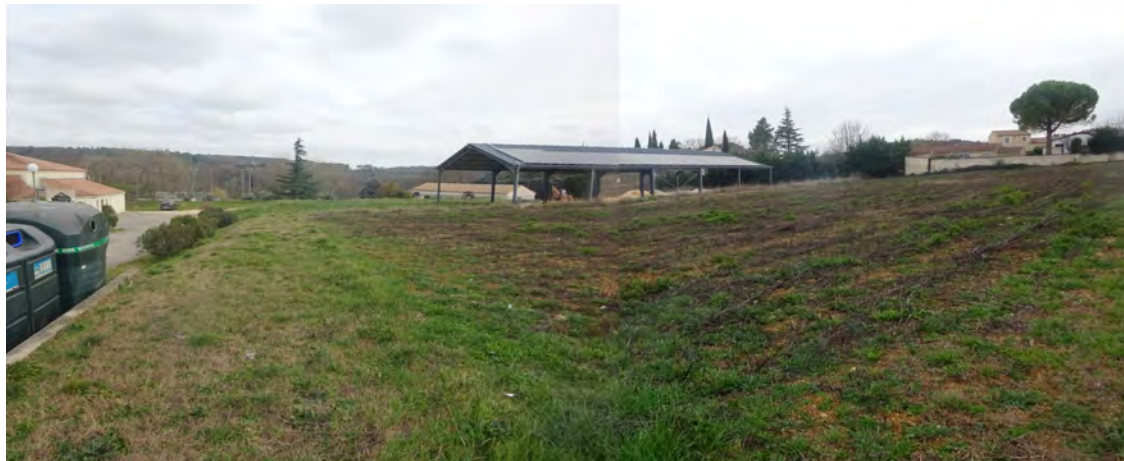
La plateforme supérieure